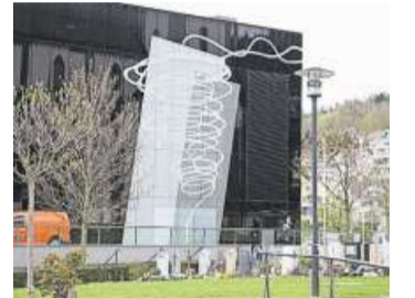
Die Aegerihalle wurde prämiert.

Die Aegerihalle in Unterägeri wurde im Rahmen des Swiss Location Awards 2021 mit dem Gütesiegel «Ausgezeichnet» als eine der besten Eventhallen der Schweiz prämiert. Rund 30000 Veranstalter und Besucher sowie eine unabhängige Fachjury haben am diesjährigen Swiss Location Award mitgeholfen, die nominierten Locations zu bewerten. pd