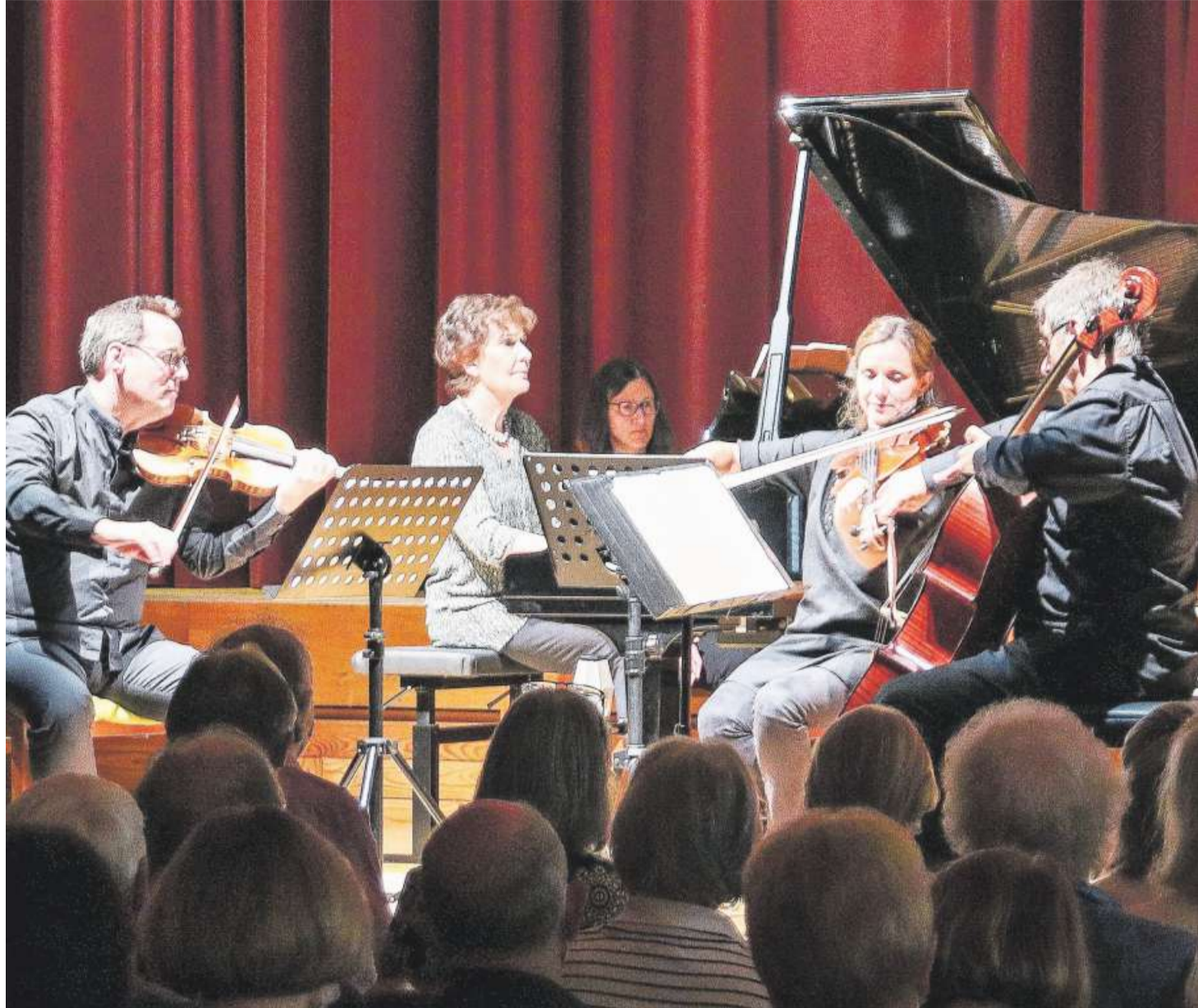
In der Maienmatt in Oberägeri fand der erste Anlass der Konzertreihe Sommerklänge statt. Es spielte das Ensemble Chamäleon.

Gegen einen Unkostenbeitrag von 20 Franken veröffentlichen wir Ihren Event (bis zu sechs Zeilen) auf dieser Seite. Für 175 Franken können Sie ein Premium-Event (siehe unten) mit Bild und 20 Zeilen Text buchen. Buchen Sie Ihren Eintrag online unter www.zugerpresse.ch